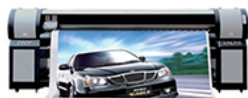
Lebar area cetak 3,2m

EVO merupakan printer handal dengan investasi rendah yang dapat di upgrade agar anda dapat melayani lebih banyak pelanggan dan lebih banyak order seiring perkembangan usaha anda, serta biaya produksi yang efisien. Jangan ketinggalan kembangkan usaha anda berlipat ganda.