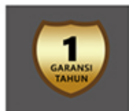
Garansi 1 Tahun